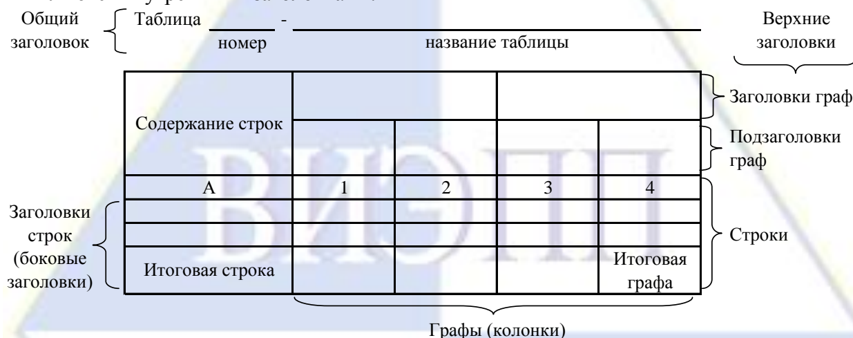
Рисунок 2 – Остов (основа) таблицы

Цифровой материал, как правило, оформляют в виде таблиц. Таблица содержит три вида заголовков: общий, верхние и боковые (рис. 2). Общий заголовок отражает содержание всей таблицы (к какому месту и времени она относится), располагается над ее макетом и является внешним заголовком. Верхние заголовки характеризуют содержание граф, а боковые – строк. Они являются внутренними заголовками.